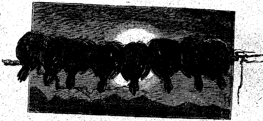
Ἐκ τοῦ Τυπογραφείου τῶν Καταστημάτων Ἀνάστη Κωνσταντινίδου 1896.

Ο τόμος οὗτος περιέχει 225 εικονογραφίας καὶ κοσμηήματα.